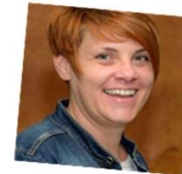
Juridisch adviseur/ Staatssteun