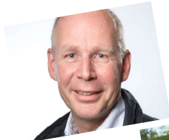
Projectadviseur Interreg DU - NL