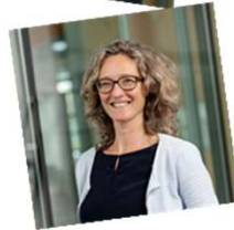
Coördinator MKB-plus faciliteit