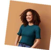
Projectadviseur Interreg VL - NL