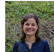
Beleidsmedewerker Nieuwe EU Kansen