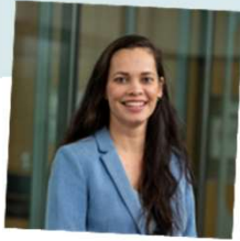
Opdrachtnemer Europese programma's