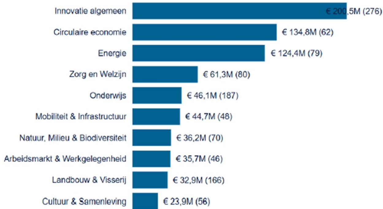
Figuur 1: Europese subsidie (en projecten) per bestuurlijk thema in Noord-Brabant